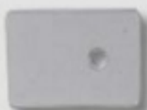
Pannello di calibrazione del sensore