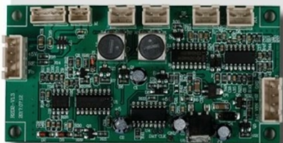
BF-01 Scheda di controllo del sensore