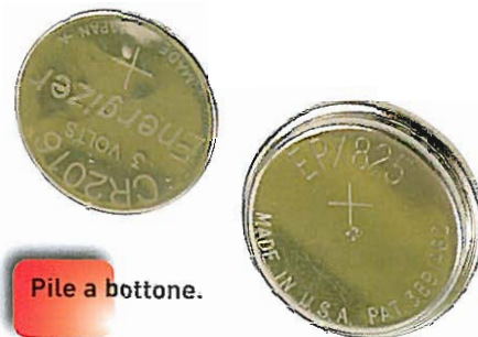
Pile a bottone.

Sono composte da zinco metallico, cloruro di ammonio e di ossido di manganese.