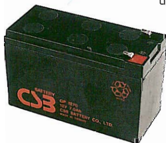
Batteria al piombo.

Sono le classiche batterie dell'automobile. Sono formate da sei pile da 2 Volt, per ottenere 12 Volt nominali per il loro