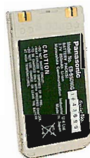
Pila ricaricabile allo ione litio.

Non sono ricaricabili, però esiste un tipo di pila ricaricabile