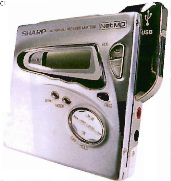
MINI-DISC. Registratore digitale attualmente molto utilizzato.

• Programmazione del tempo di registrazione. Permettono di realizzare registrazioni in modo automatico a ore predeterminate o impostate in precedenza.