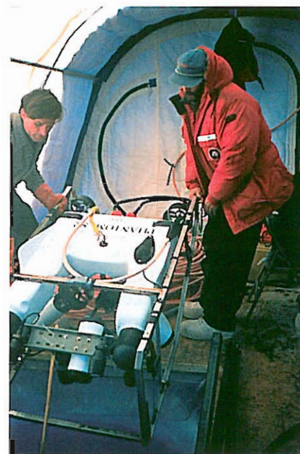
Robot per l'esplorazione sottomarina alimentato da batterie.

— Idrogeno e pile di combustibile : gli esperti lo considerano il combustibile del futuro. Le pile di combustibile si presentano come una tecnologia ingegnosa e molto promettente, che potrebbero fornire parte dell'energia necessaria in futuro con un impatto ambientale nullo, dato che producono energia senza che sia necessaria alcuna combustione; infatti liberano energia utilizzando un metodo pulito ed efficace, l'ossidazione elettrochimica, che produce elettricità e calore utile.