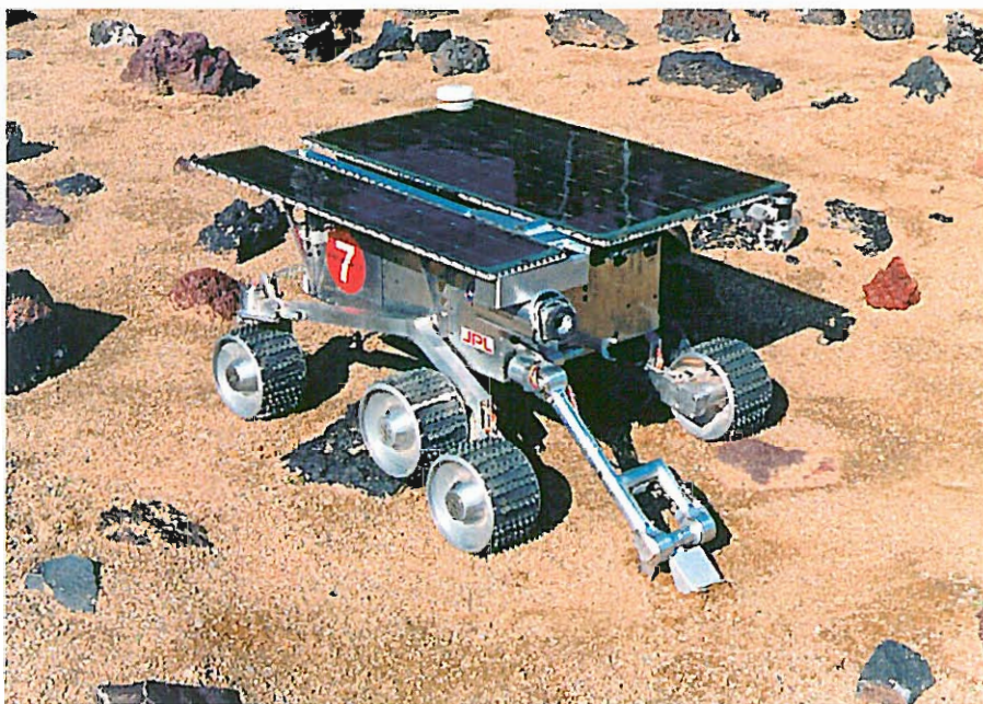
Robot per l'esplorazione di Marte con alimentazione solare.

L'elettricità che si ottiene in questo modo, può essere utilizzata in modo diretto, ad esempio, in un motore elettrico, o essere immagazzinata in accumulatori per l'utilizzo nelle ore notturne.