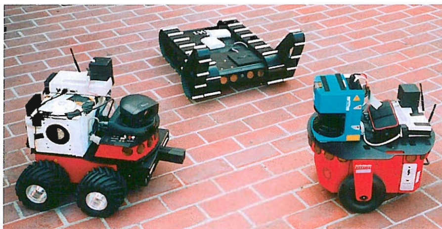
Immagini di diversi robot che collaborano per differenti lavori.

industrializzato e attualmente il tasso di crescita nell'utilizzo degli stessi è del 20%. Altre applicazioni dei robot corrispondono a compiti pericolosi e/o disagiati per gli umani, ad esempio, nei laboratori medici in cui si manipolano materiali che comportano possibili rischi, come campioni di sangue o urina, per aiutare i chirurghi nel realizzare operazioni di altissima precisione, in attività come la localizzazione di navi affondate, la ricerca di depositi minerari sottomarini, l'esplorazione di vulcani attivi, ecc. Anche se uno dei campi più attuali è l'esplorazione spaziale di altri pianeti, in cui il loro utilizzo è fondamentale e insostituibile, come sta dimostrando il caso della sonda