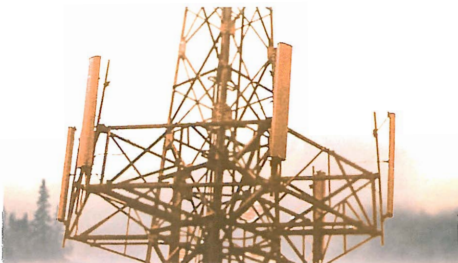
Antenna base di telefonia mobile.