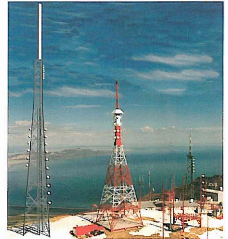
Antenna di emissione per diffusione di DTT.

Nella trasmissione in DTT si impiega un'ampiezza di banda uguale a un canale della TV analogica (8 MHz), però grazie all'utilizzo di tecniche di compressione MPEG (MP2 nel caso del sistema DVB-T) per audio e video, tramite questo canale è