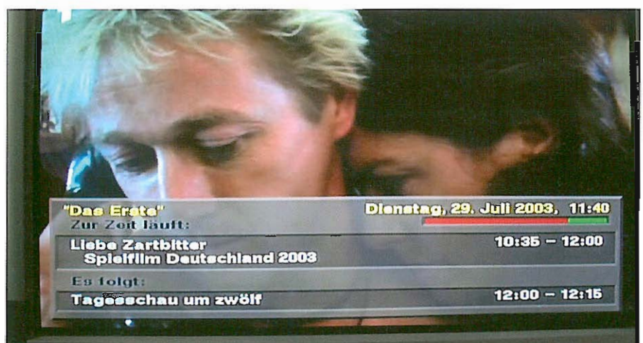
Gli STB presentano sul video servizi aggiuntivi.

possibile inviare programmi con qualità audio e video molto alta, oppure più di un programma, ma con minore qualità (ad esempio cinque, con i quali si potrebbe ottenere una qualità in ognuno di essi simile a quella della TV attuale). Per quanto riguarda lo