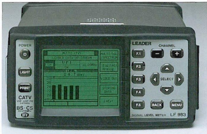
Analizzatore di segnali televisivi, fra cui DTT.