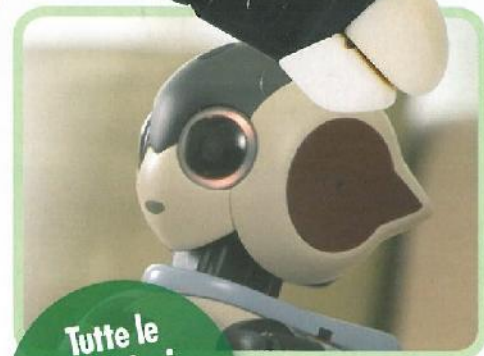
Tutte le istruzioni di montaggio step by step