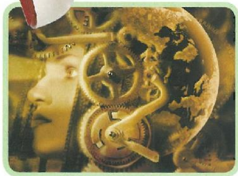
La meccanica degli ingranaggi