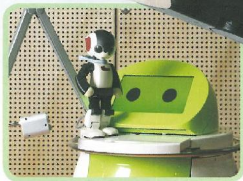
Terapio, un valido aiuto in ospedale