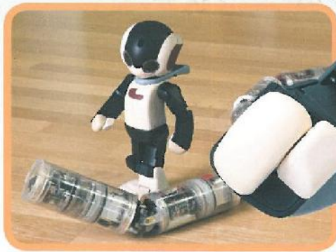
Il module robot MMS