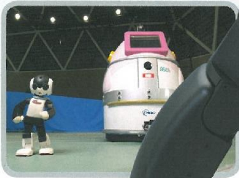
ASKA, il robot giocherellone